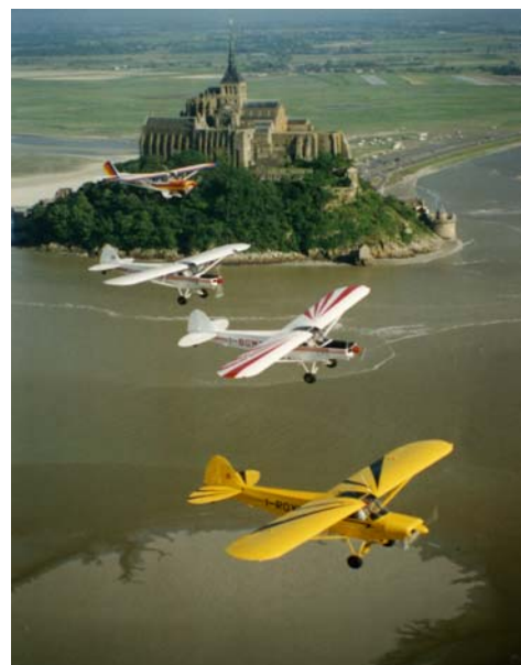
Pattuglia di PA18 su Mont St. Michel

per vedere le foto, leggere i racconti e consultare il Regolamento visitate il nostro sito www.aipm.it