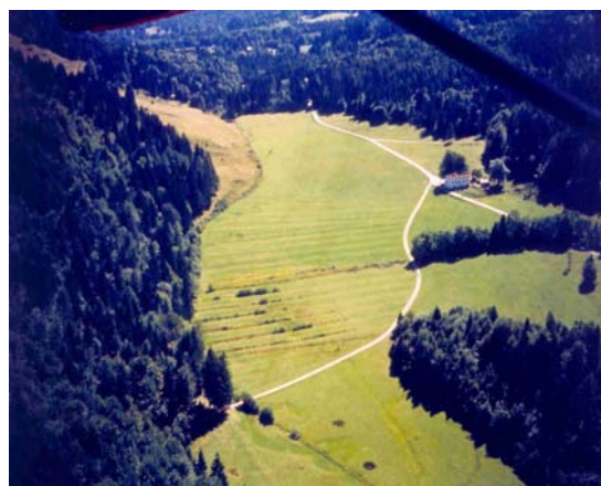
Aviosuperficie Sella Valsugana

Oltre alla realizzazione del sito ufficiale, per il quale siamo impegnati nel suo costante miglioramento ed aggiornamento, molte altre sono le iniziative in corso. Con il nostro Notiziario sarete costantemente informati.