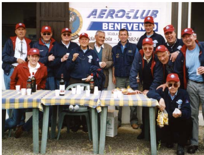
I piloti dell'AIPM ospiti dell'Aeroclub di Benevento

Nei giorni 23-24-25 Aprile si è tenuta a Benevento la nostra Assemblea. Il tempo buono ci ha aiutato a realizzare nei tre giorni stabiliti il programma previsto potendo alternare momenti istituzionali ad altri di puro godimento. Il numero dei partecipanti è stato ridotto, erano in tutto solo 12, ma il gruppetto dei soci di Trento, Treviso e Belluno partiti con i loro PA 18, ai quali si è aggiunto anche un Cessa 172 dell'aero-club di Belluno, ha costituito una rappresentanza qualificata e l'affiatamento ne è risultato totale. Dopo aver fatto sosta a Castiglione Fiorentino, dall'amico "Toneo" Budini Gattai, siamo arrivati a Napoli, gustando una piacevole serata sotto una luna da cartolina. Sabato 23 l'arrivo a Benevento e, dopo un'intensa visita ai luoghi archeologici della